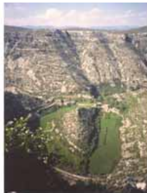
Cirque de Navacelles