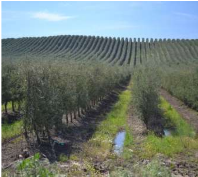
Plantations intensives d'oliviers en Alentejo

L'appel à communication est à rédiger. Se pose la question des langues : Le français et l'anglais sont incontournables. Quid du portugais ?