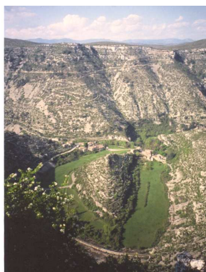
Cirque de Navacelles